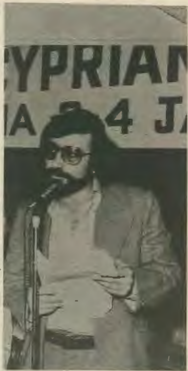
καί μπορεί να λυθεί μόνο μέσα σε διεθνή πλαίσια.